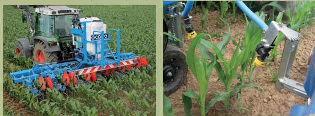
Figure 2 : Système de pulvérisation localisée sur le rang couplé à un binage sur l'interrang

Le traitement plante par plante n'est pas autorisé.