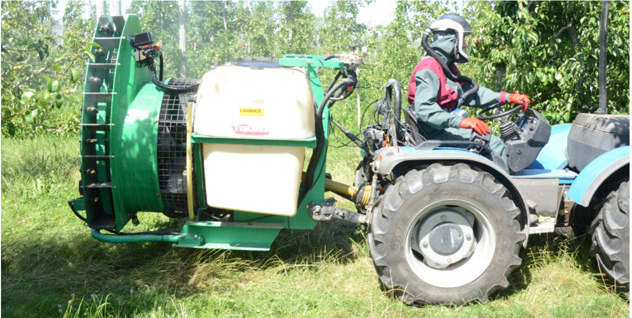
Se si eseguono i trattamenti con un trattore non dotato di cabina di categoria 4, equipaggiarsi secondo le informazioni riportate nell'applicazione web.