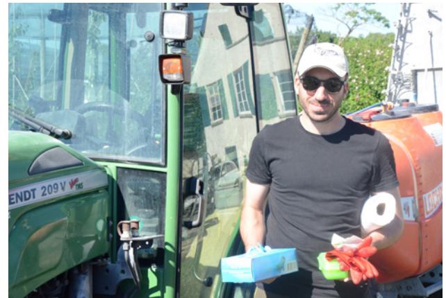
In una cabina di categoria 4 è necessario avere sempre con sé guanti e ugelli di ricambio, un piccolo sacchetto per la spazzatura e un rotolo di carta da cucina.

A differenza dei frutteti a basso fusto, in quelli ad alto fusto si utilizzano principalmente irroratrici a lancia (gun) o atomizzatori per alberi ad alto fusto. Anche in questo caso vale quanto segue: se il trattamento non viene effettuato con un trattore dotato di cabina di categoria 4 EN 15695-1, l'utilizzatore deve provvedere a un'adeguata protezione secondo la l'applicazione web sullo standard per la protezione dell'utilizzatore.