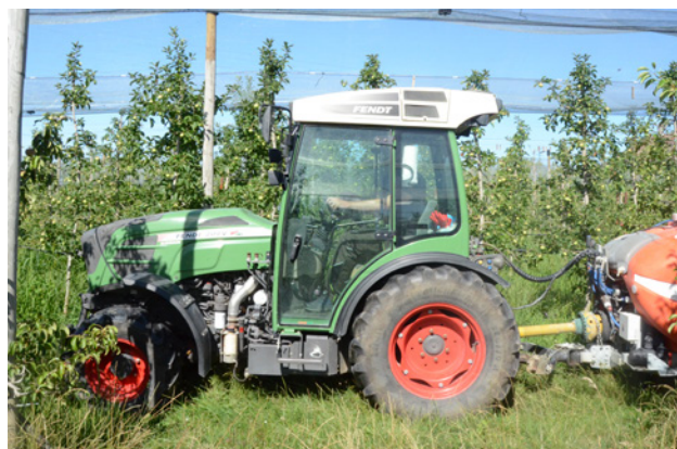
Solo con una cabina del trattore di cat. 4 o equivalente (filtrazione a tre stadi) si può fare a meno dei DPI durante il trattamento.

La categoria è di solito indicata in cabina su una targhetta o un adesivo. Per le cabine di categoria 4, il filtro ha tre livelli: un pre-filtro (particelle grossolane), un filtro antiparticolato (polveri e aerosol) e un filtro a carbone attivo (vapori e gas). Il filtro deve soddisfare i requisiti della norma EN 15695-2. I trattori più vecchi ma con una cabina ermetica e ben tenuta, aria condizionata e un filtro a tre stadi sono considerati una protezione sufficiente. All'interno della cabina, l'operatore dovrebbe in ogni caso indossare indumenti dedicati esclusivamente alla manipolazione dei prodotti fitosanitari. In cabina dovrebbero esserci una scatola di guanti monouso o un paio di guanti puliti e riutilizzabili, ugelli di ricambio, asciugamani di carta e un piccolo sacchetto per i rifiuti. L'irroratrice deve essere inoltre dotata di un contenitore di acqua fresca per risciacquare i guanti e le mani.